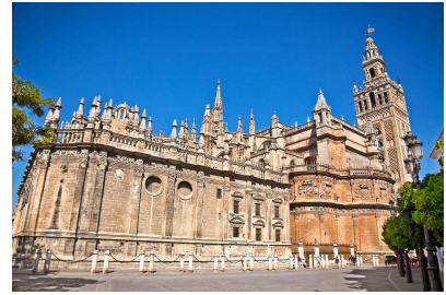
La Catedral en Sevilla

1 Haz el concurso sobre Andalucía en tu libro páginas 110-111 y apunta las respuestas.