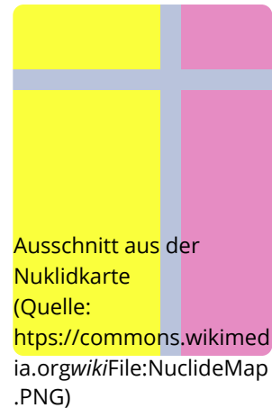
Ausschnitt aus der Nuklidkarte